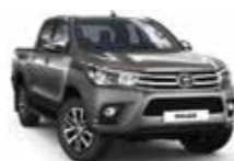
1G3 Сірий 2