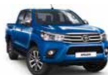
8X2 Блакитний 2

Вся інформація, представлена у цьому матеріалі, є точною та дійсною станом на дату публікації 01.03.2016.