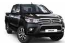
218 Чорний 2