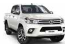
070 Білий перламутр 2