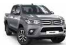
1D6 Сріблястий 2