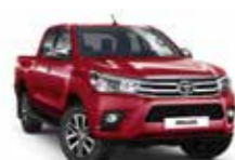
3T6 Червоний 2