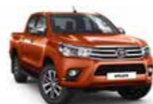
4R8 Оранжевий 2