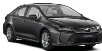
1G3 Сірий, металік