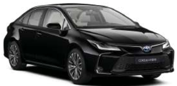
209 Чорний, металік