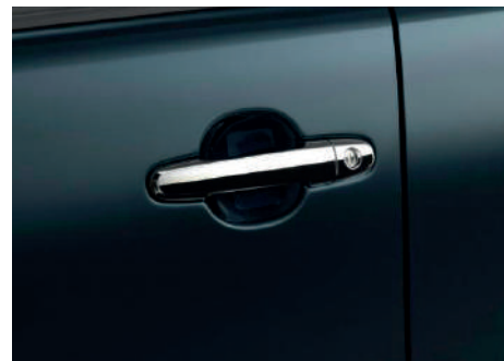
Захисна плівка під ручки дверей