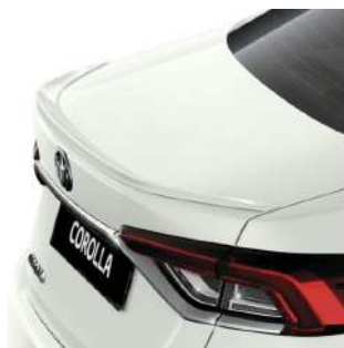
Спойлер кришки багажного відділення