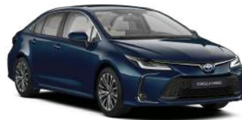
785 Темно-бірюзовий, металік