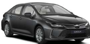
1K3 Сіро-блакитний, металік