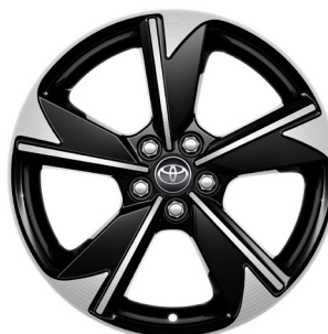
Легкосплавні диски 15", чорні