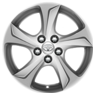
Легкосплавні диски 15"