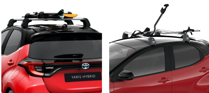
Поперечини даху, кріплення для велосипеда