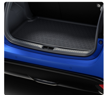
Килимки салону, гумові, Килимок багажника, гумовий