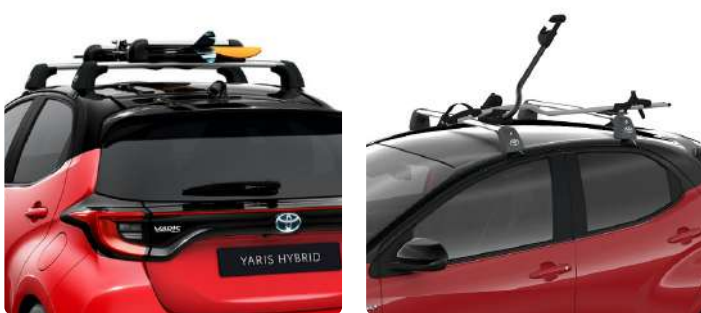
Поперечини даху, кріплення для велосипеда