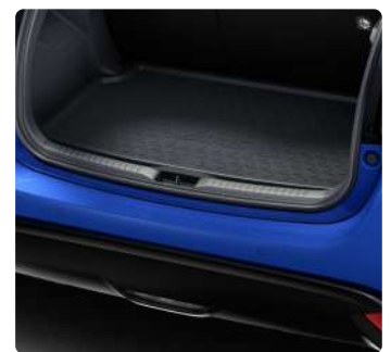
Килимки салону, гумові, Килимок багажника, гумовий