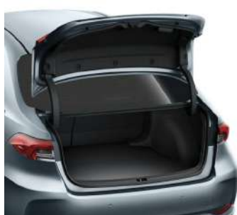
Килимок багажного відділення, текстильний