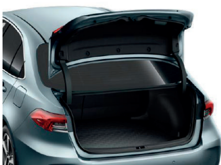
Килимок багажника, гумовий