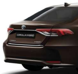
Хромована накладка кришки багажного відділення