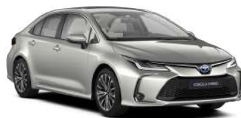
1J6 Платиновий, перламутр новий