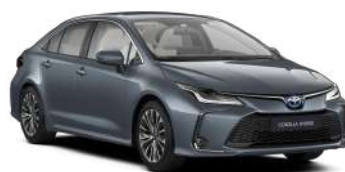
1K3 Сіро-блакитний, металік