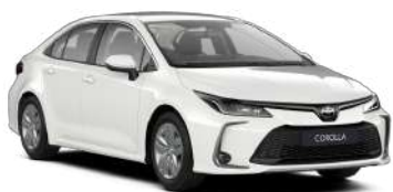
040 Білий, лак