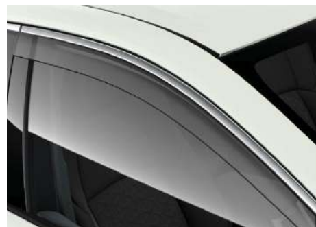
Дефлектор вікон з хромованим окантуванням