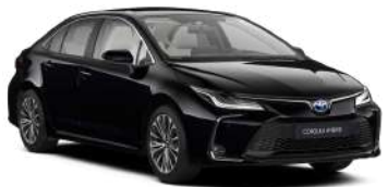
209 Чорний, металік