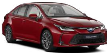
3U5 Червоний, перламутр