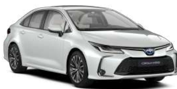
089 Білий, перламутр