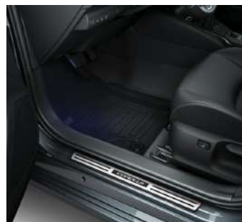
Алюмінієві накладки порогів