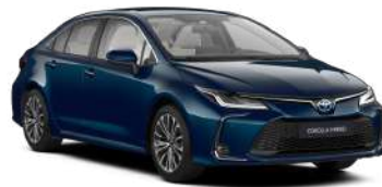
785 Темно-бірюзовий, металік