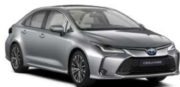
1L0 Сріблястий, металік