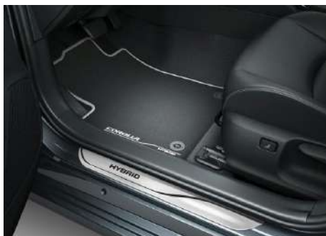
Килимки салону, текстильні з логотипом