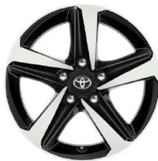
Легкосплавний диск 16", чорний з механічно обробленою поверхнею