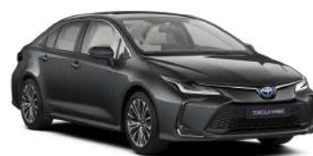
1G3 Сірий, металік