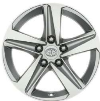
Легкосплавний диск 16", сріблястий