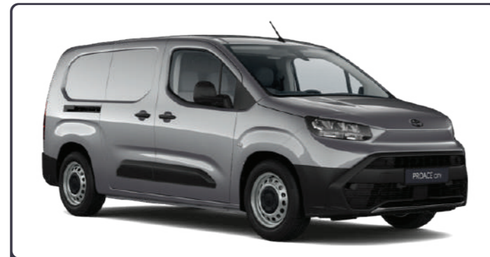
КСА Сріблястий, металік